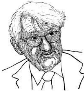
De intellectuele 'koning' van Starnberg: Jürgen Habermas

Ethiek is gezien vanuit de discousethiek niet iets voor een dashboard met meters voor de snelheid of voorraadverbruik per deugd, waarde of principe. De discousethiek wijst op het belang van alle betrokkenen in een proces van gezamenlijke besluitvorming. Dat vereist een actieve opstelling van deelnemers. In een gezondheidszorgcasus zal de hulpverlener een actieve verbale opstelling moeten tonen in de vorm van initiatief, stimulering, overtuiging, het overnemen van de beslissing. Een dialoog vanuit de discousethiek eindigt niet vrijblijvend. Maar mochten de betrokkenen concluderen tot een opname in een zorgcentrum, dan zal er wel 'een plek vrij moeten zijn'.